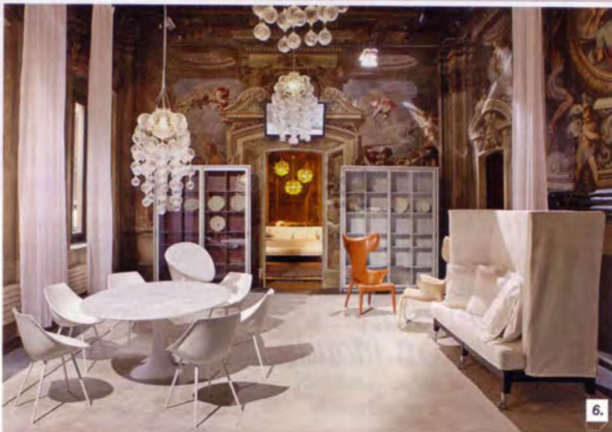
6. UNA DELLE NOBILI SALE DELLO SHOWROOM MILANESE DI VIA MANZONI ALLESTITA CON ALCUNI PRODOTTI DELLA NUOVA COLLEZIONE DRIADE 2011.

ricerche che coincidono con l'approfondimento di matrici culturali specifiche. La spagnola Urquiola, con la poltrona Pavo real outdoor, si è fatta interprete di un'ulteriore operazione di rivisitazione della tipologia delle grandi sedute-trono in rattan e midollino diffuse nei Paesi del sud-est asiatico. Che realizzate in alluminio e filo sintetico, dilatate nei volumi e infittite negli intrecci, decorate per frammenti si caricano di un accento esotico ancora più forte. I giapponesi Nendo, alla loro prima collezione Driade, hanno invece proposto Forest, una libreria che vive di sapienti contrappunti dinamici orchestrati dagli elementi verticali e orizzontali che ne definiscono la composizione.