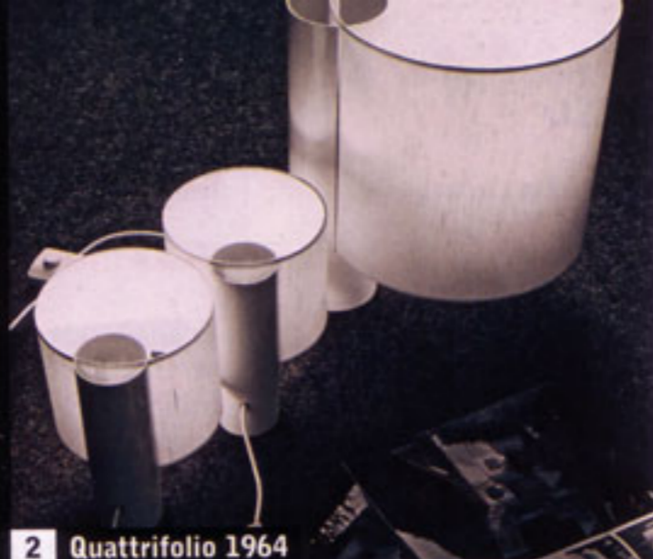
2 Quattrifoglio 1964